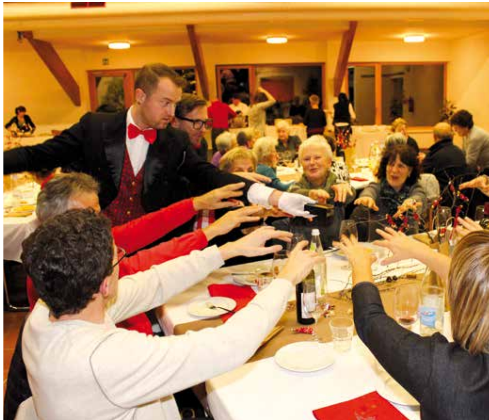
Festa del volontariato

La ditta ACS Data System Spa è stata incaricata alla fornitura ed al montaggio degli accessori per due display esterni presso le fermate dell'autobus a Varna. La relativa spesa ammonta a 3.904,00 Euro.