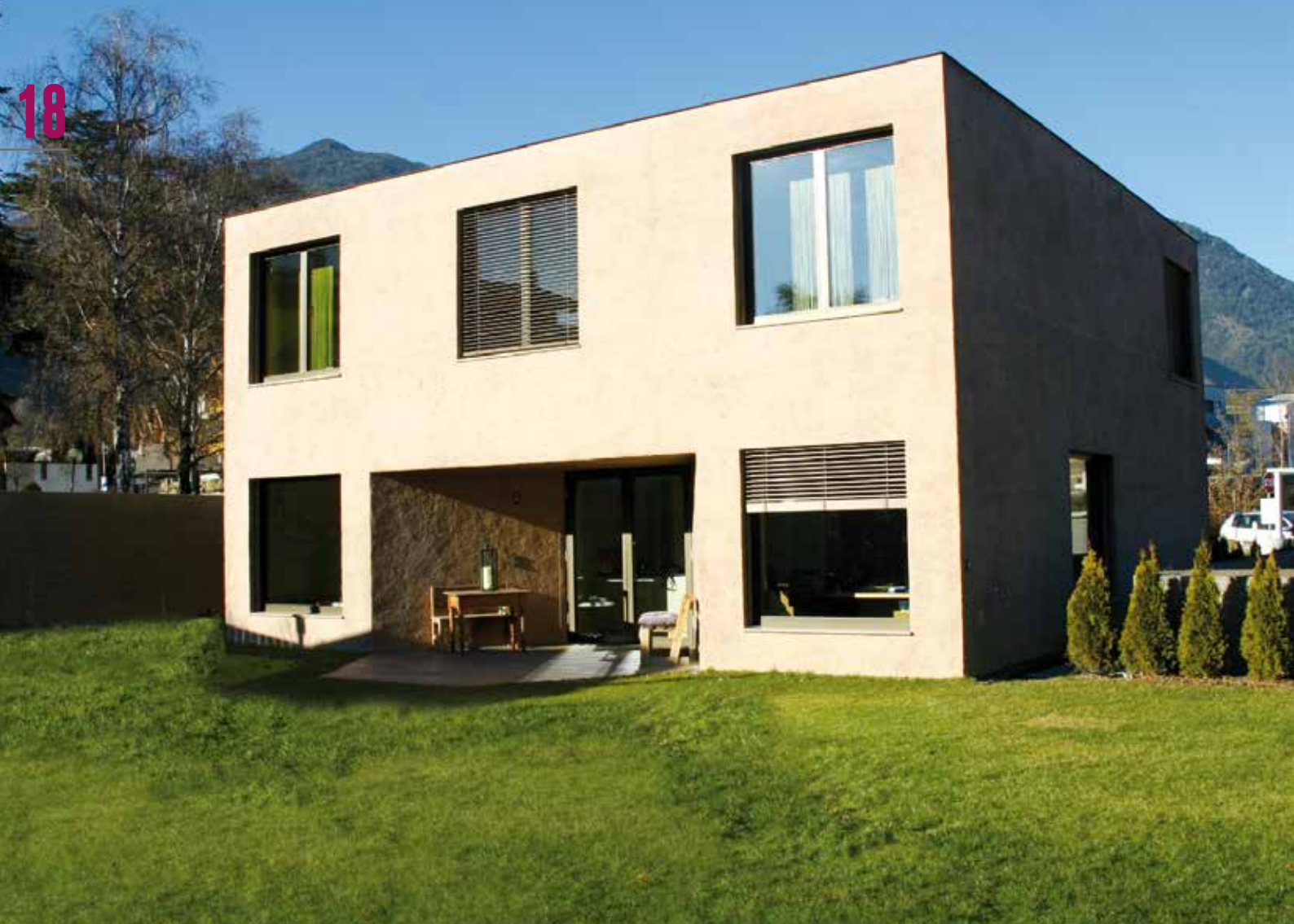
Edificio residenziale a Varna