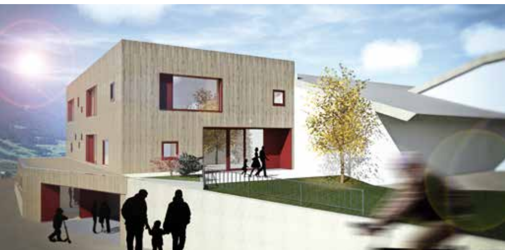
Ampliamento della scuola materna di Varna