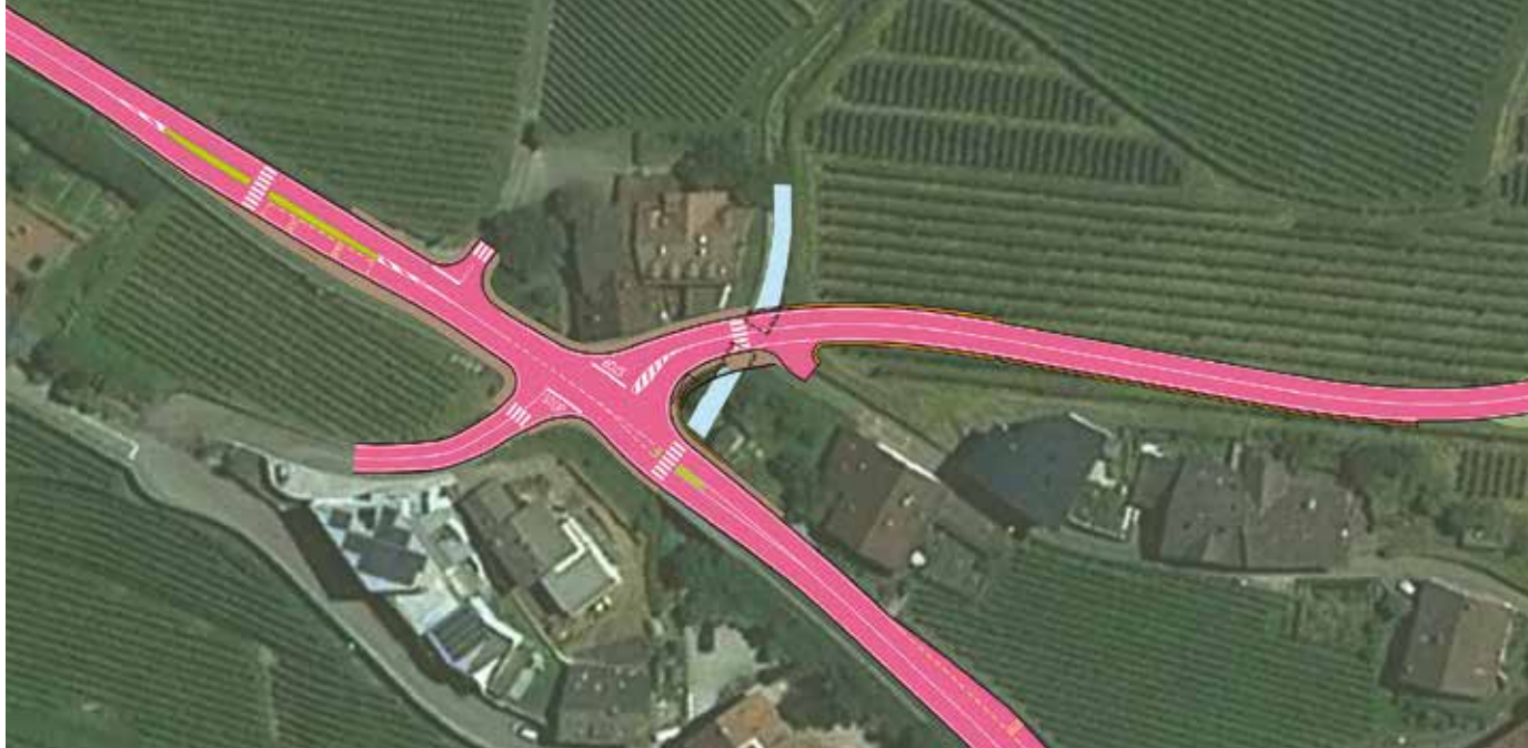
Nuovo incrocio e strada verso la zona residenziale Seiserleite