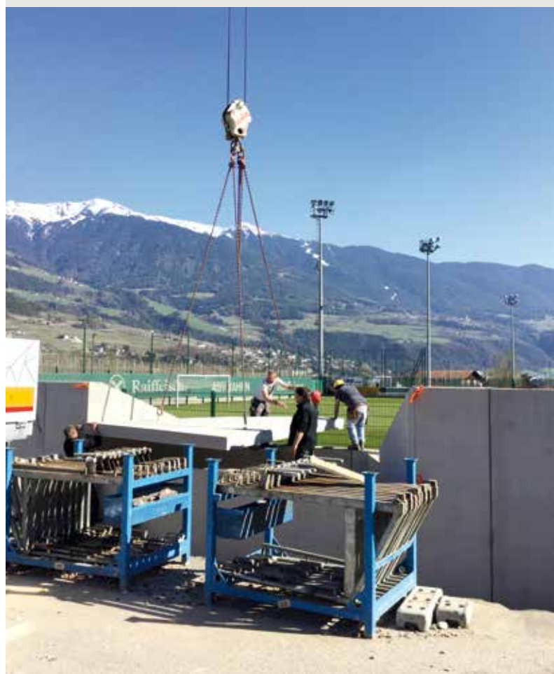
Montaggio dei prefabbricati in calcestruzzo della tribuna nella zona sportiva a Varna

Su richiesta del proprietario dell'edificio sulla p.ed. 52/1 – Ristorante „Goldener Adler“ – del C.C. Varna I, per lo spostamento delle condutture per il teleriscaldamento e dei tubi per la fibra ottica attraverso la p.f. 137/5 del C.C. Varna I verso il Condominio Strickner e la casa d'abitazione Salcher dove essere inserita una servitù. Per questo è stato liquidato un importo una tantum ed un'indennità per l'occupazione di complessivi 4.500 Euro. Le spese contrattuali e le imposte per l'intavolazione ammontavano a 1.175,00 Euro.